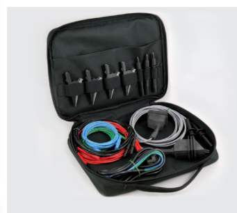
Borsa di trasporto per accessori (di serie)