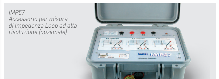
IMP57 Accessorio per misura di Impedenza Loop ad alta risoluzione (opzionale)