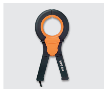
HT96U - Pinza per corrente di dispersione AC (opzionale)