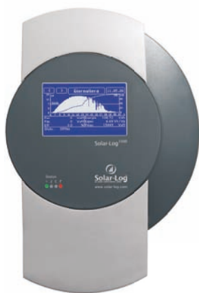
Coperchio speciale allungato

Attenzione: per il corretto funzionamento della protezione contro le sovratensioni è sempre necessario il collegamento a terra.