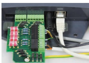
Scaricatore di sovratensione montato